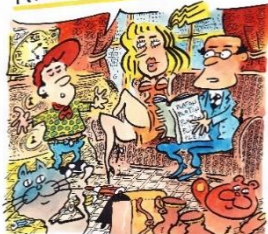
Dessin de Pecub

POUR M' ACCOMPAGNER, VOUS N' AURIEZ PAS 100 IDÉES À HAUT POTENTIEL ?